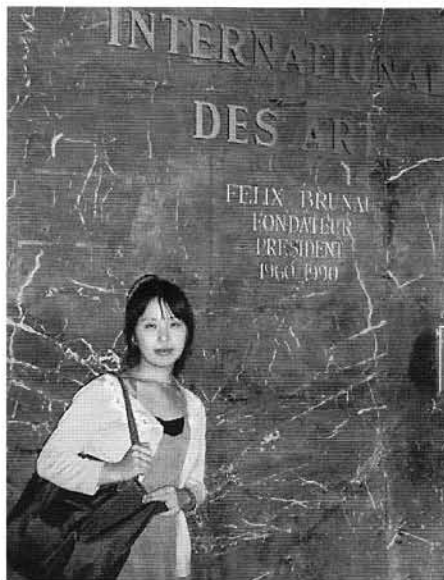
シテ・デザール入口にて

留学生活が始まる前は、生活面 や言葉の壁など不安でしたが、留 学中に滞在したシテ・デザールは パリの中心地にあり、歩いて行 ける距離にい ろいろな店が あったのでと ても便利でし た。「日本食 が恋しいな」 という時は、 オペラ地区の 日本人街で食 材を買って、 寮のキッチン で自炊したり